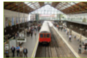
Estación de trenes